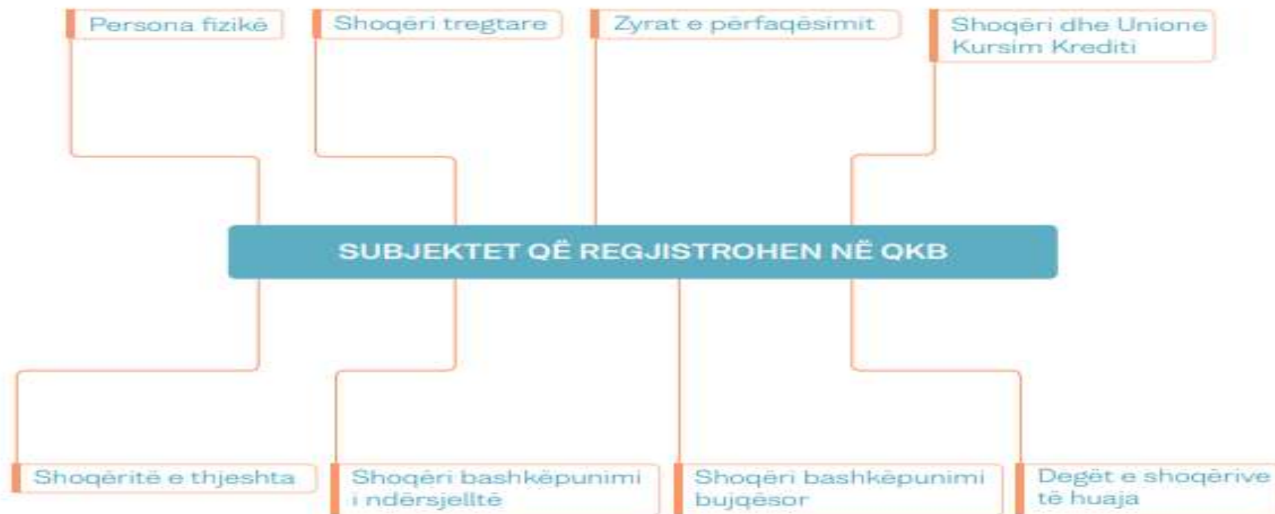
Skema 2: Subjektet që kanë detyrimin e regjistrimit në regjistrin tregtar të QKB

Sistemi ekonomik i Republikës së Shqipërisë bazohet në ekonominë e tregut dhe në lirinë e veprimtarisë ekonomike. Veprimtaria ekonomike nxitet dhe gëzon mbrojtje nga legjislacioni shqiptar.